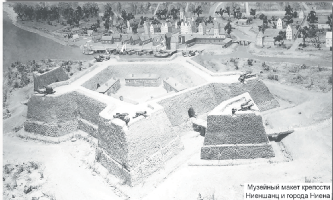
Музейный макет крепости Ниеншанц и города Ниена

цию в Россию. Шведы овладели устьем Невы, захватили деревню Усть-Охту, построили крепость Ниеншанц. Под её прикрытием расцвел богатый город Ниен. В нём было около четырёхсот домов – деревянных с садиками, а в центре – каменные строения: лютеранская церковь, дом шведского коменданта и корпуса военного госпиталя. В устье Невы шведы построили много складов, пакгаузов, амбаров, мельниц, верфей. Город торговал с Европой зерном, мукой, пенькой, пушниной и прочими русскими товарами, то есть фактически занимался посреднической перепродажей.