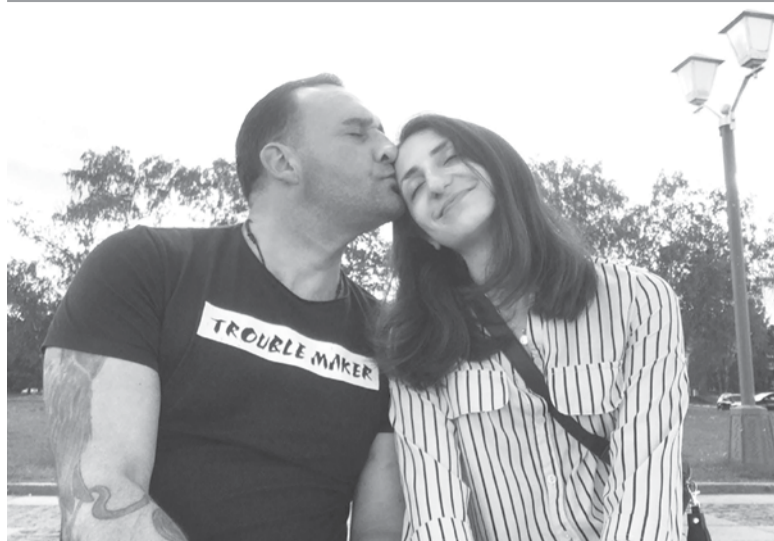
Они всегда вместе

– А если посмотреть на себя со стороны, какого качества вам недостаёт, но Вы над этим работаете?