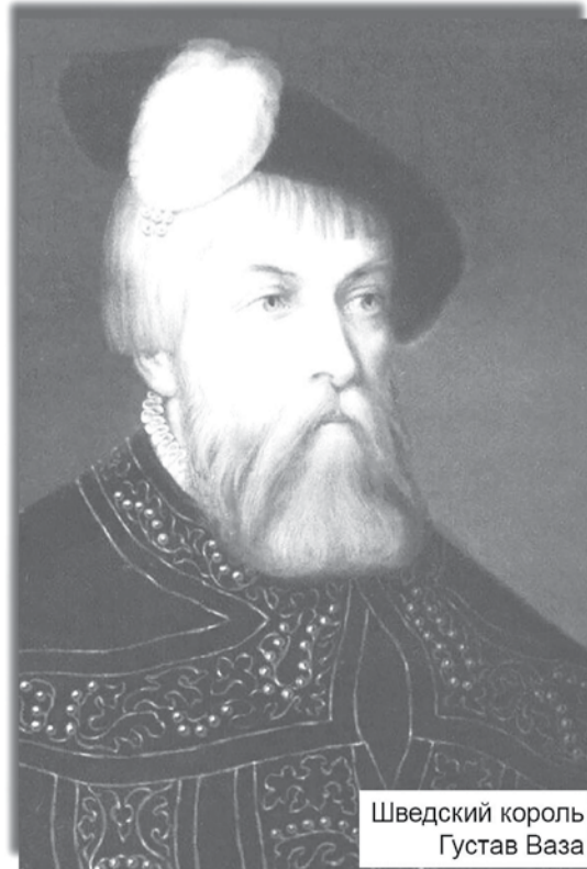
Шведский король Густав Ваза

7 сентября 1582 года шведы подвели свою флотилию к истоку Невы и блокировали Орешек, пытаясь воспрепятствовать снабжению крепости водным путём. По Ладоге курсировали 50-60 русских ладей, но ввиду опасности они укрывались за стенами крепости во внутрен-