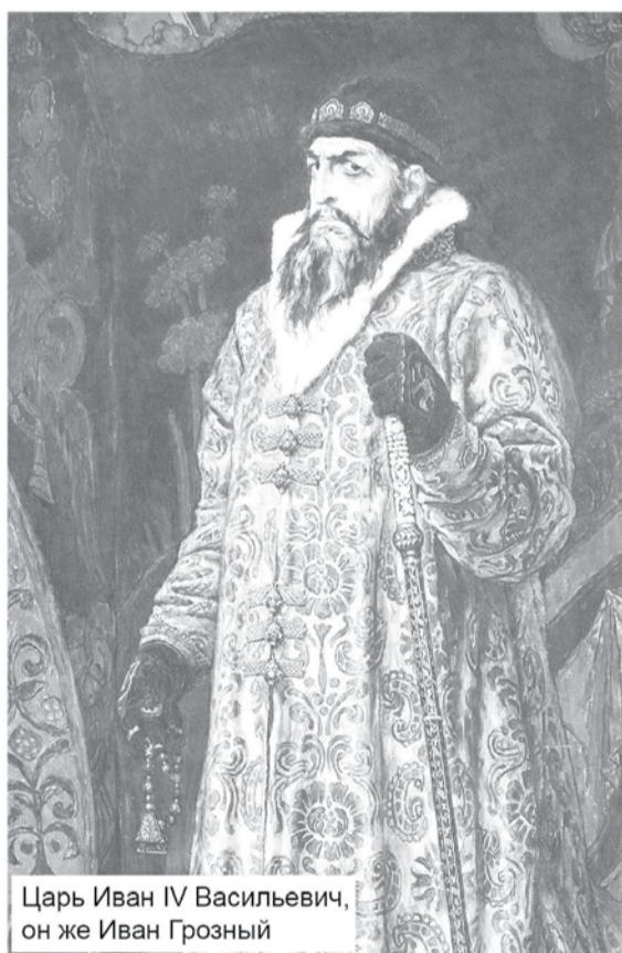
Царь Иван IV Васильевич, он же Иван Грозный

ся, и Ливонская война перетекла в войну с Литвой и Швецией.