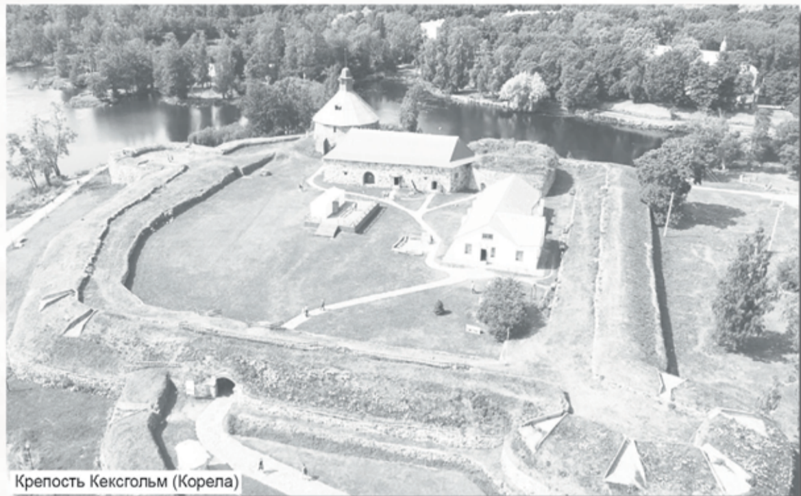
Крепость Кексгольм (Корела)

в Неву, отряд блокировал крепость Нотебург (Орешек), затем спустился по реке и внезапным налётом взял город Ниеншанц. А в Финском заливе казаки атакова-