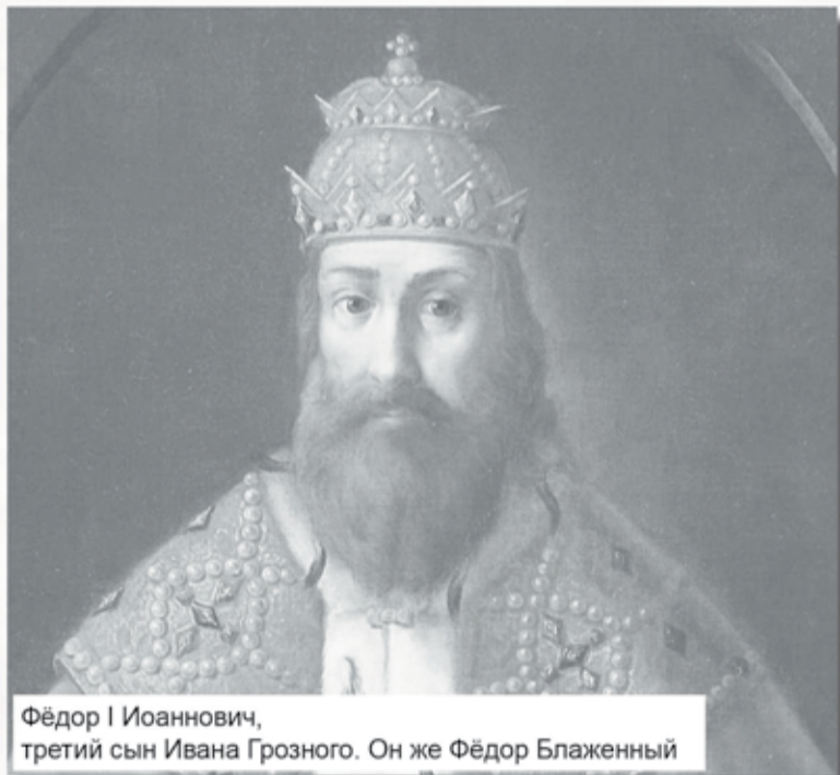
Фёдор I Иоаннович, третий сын Ивана Грозного. Он же Фёдор Блаженный

20 января 1593 года в Ивангороде между русскими и шведами было заключено очередное перемирие сроком на два года. Однако уже в марте 1594 года шведы нарушили его и несколько раз нападали на русские пограничные районы. Московское правительство не стало устраивать ответных действий. 9 ноября 1594 года в деревне Тязино рядом с Ивангородом начались мирные переговоры. Они шли довольно долго – мир был подписан только 18 мая 1595 года.