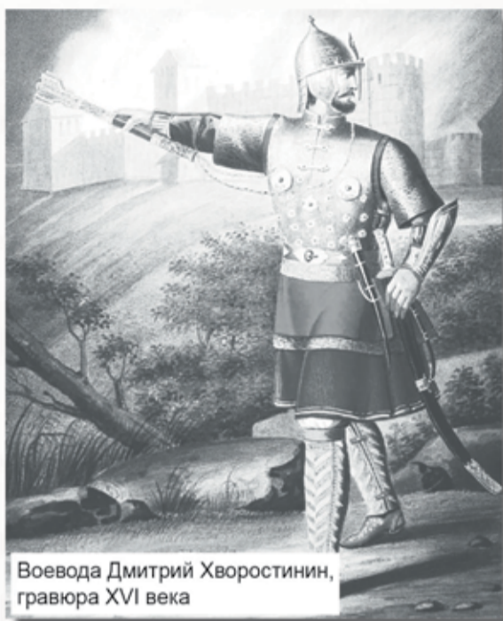
Воевода Дмитрий Хворостинин, гравюра XVI века

представителями, завершившиеся подписанием в мае 1583 года Плюсского перемирия, по которому Швеции отдавались Ивангород, Ям и Копорье с прилегающей к ним территорией южного побережья Финского залива. Устье Невы, тем не менее, осталось в руках России.