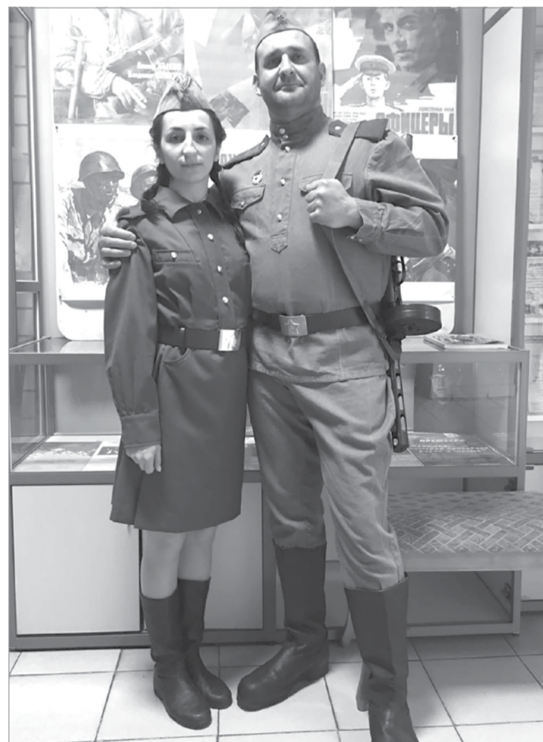
После концерта «Песни военных лет»